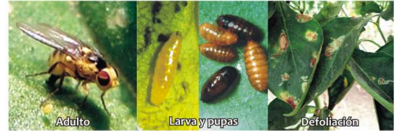
Minador Liriomyza sp.