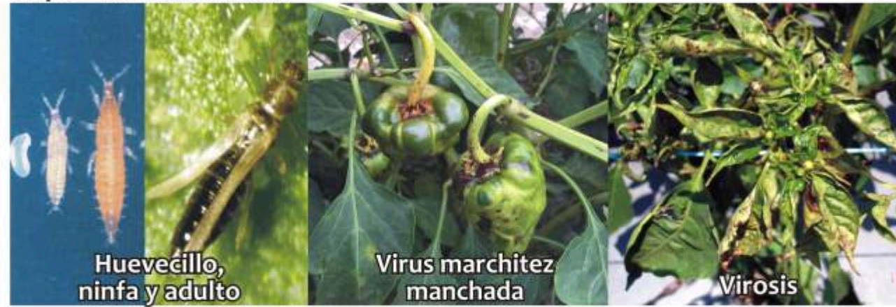
Trips Frankliniella sp, Trips sp.