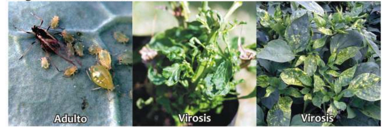
Pulgones Myzus sp, Aphis sp.