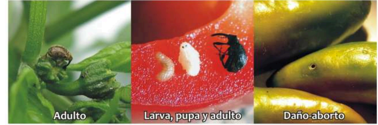
Picudo Anthonomus eugenii