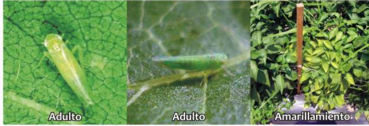
Chicharrita Empoasca spp.