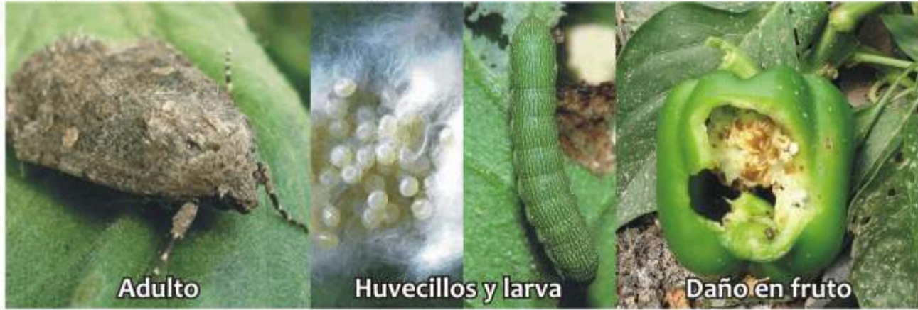
Gusano soldado Spodoptera exigua