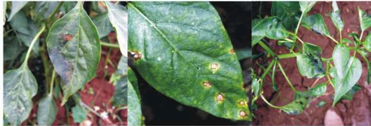
Bacteriosis Xantomonas campestris