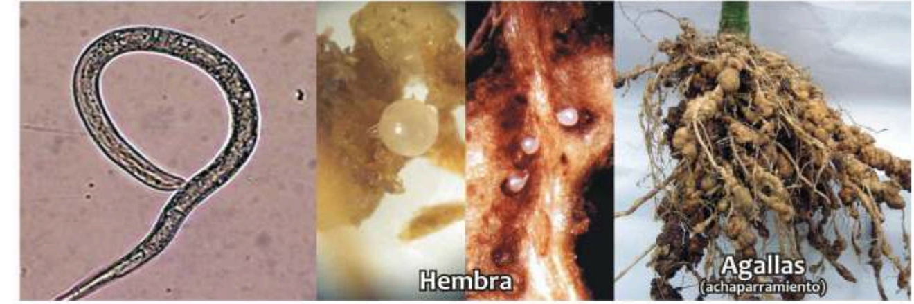
Nemátodos Meloidogyne spp.