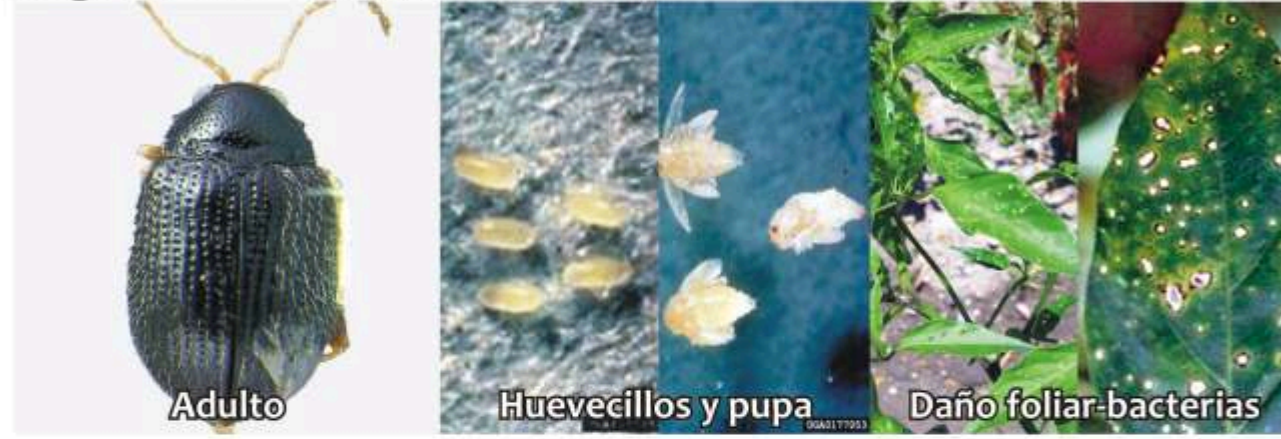
Pulga saltona Epitrix spp.