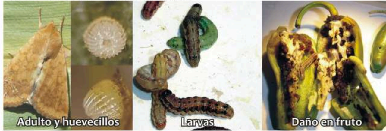
Gusano del fruto Helicoverpa zea (Boddie)