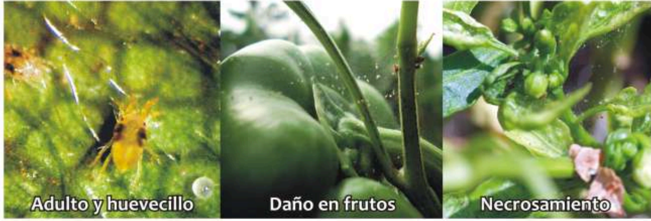
Araña roja Tetranychus urticae