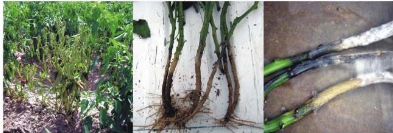
Secadera Phytophthora capsici , Rhizoctonia spp. y Fusarium spp.