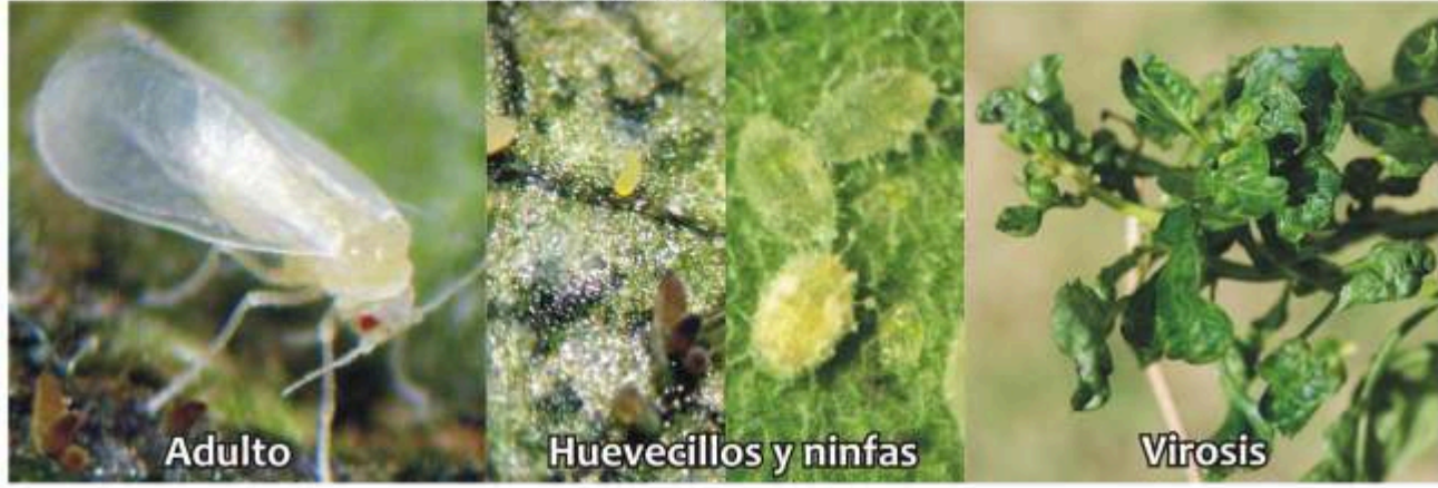
Mosca Blanca Trialeurodes vaporariorum , Bemisia sp.