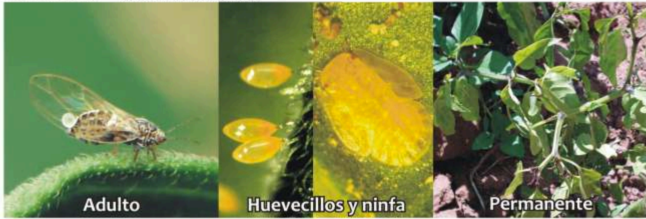
Paratrioza Bactericera cockerelli Sulc.